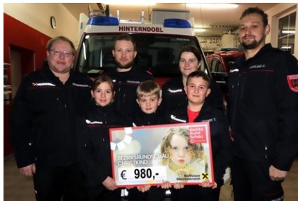
Friedenslichtaktion - Übergabe

Ein kleiner Auszug unserer Veranstaltungen von der FF-Hinterndobl und der Feuerwehrjugend.