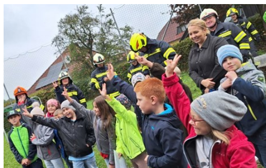
Feuerwehrrübung in der Volksschule