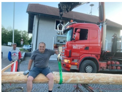
Vorbereitung der Maibaumfeier