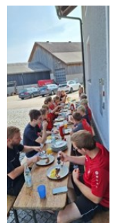
Jugendlager & 24h-Übung der Jugend