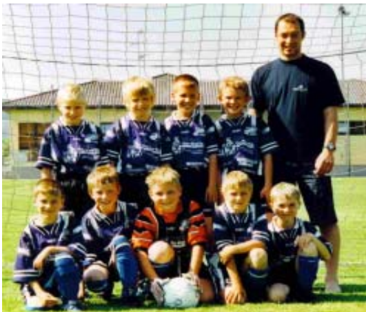
Das Team der U-9