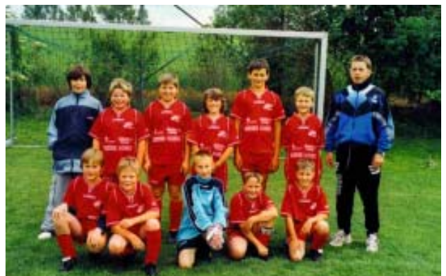
Das Team der U 11

In der Meisterschaft 2005/2006 sind wir mit folgenden Nachwuchsmannschaften im Bewerb wobei die U-15 sowie die U-17 in einer Spielgemeinschaft mit der Union Taiskirchen geführt wird.