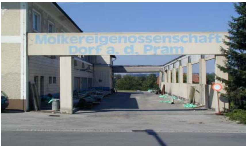
Übernahmehalle vor der endgültigen Abtragung

Nach erfolgter Abtragung der Übernahmehalle durch Herrn Markus Gerner, Hohenerlach wird am 12. September 2005 mit dem Umbau des alten Molkereigebäudes in ein neues Feuerwehrhaus und Bauhof begonnen.