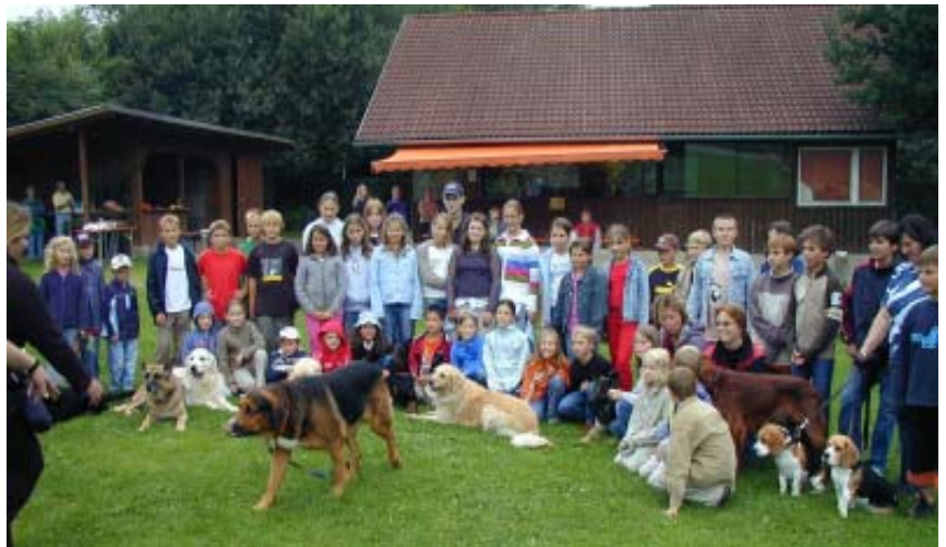
Kinder und Hunde wurden sichtlich Freunde

Umgang mit Hunden richtig und nicht ängstlich zu verhalten.